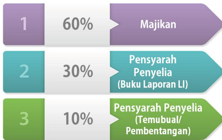
Rajah 3.1: Kriteria Penilaian LI.

Penilaian LI dibuat berdasarkan kriteria seperti dalam Rajah 3.1 dan Rajah 3.2.