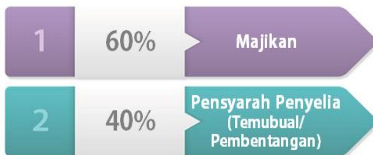
Rajah 3.2: Kriteria Penilaian LI (Sijil Asas Kolej Komuniti).