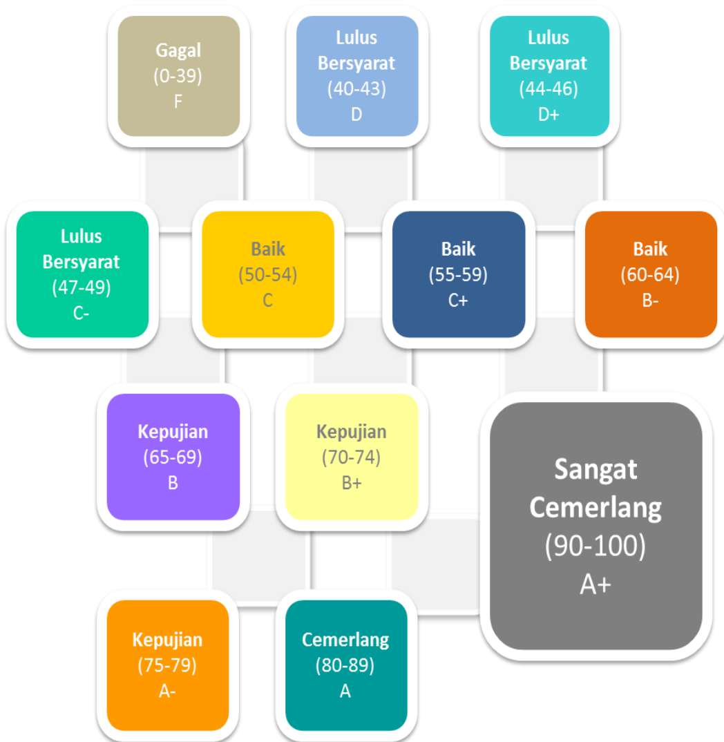
Rajah 3.3 : Gred Prestasi LI.

Prestasi LI ditunjukkan dalam bentuk gred seperti dalam Rajah 3.3.